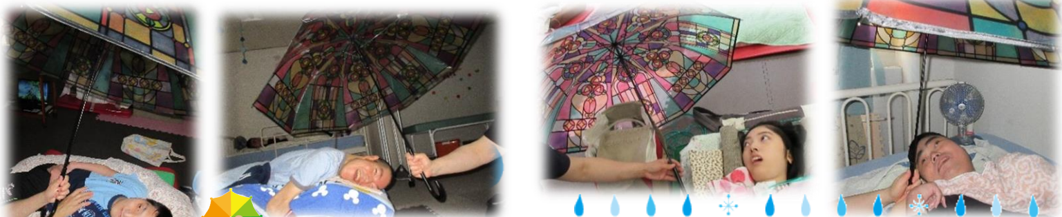
きれいな傘で雨のスターズレン 紫陽花も咲きました